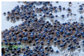
ミナミコモツギガニの群れ