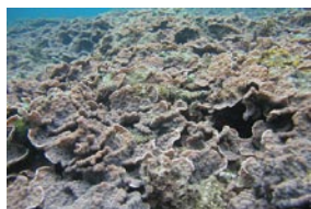
リュウキュウキッカサンゴ