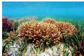
ヒメマツミドリイシと海藻