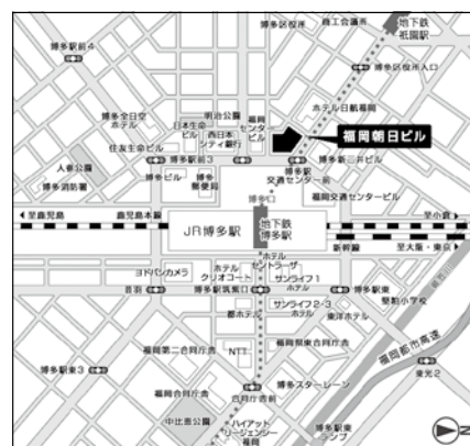
福岡朝日ビル TEL 092-431-1228 福岡市博多区博多駅前2-1-1