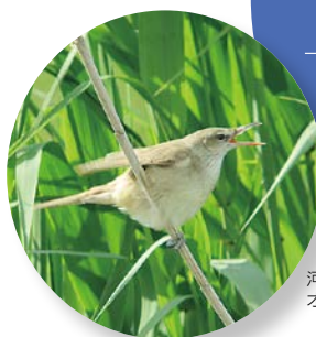
河北潟の オオヨシキリ