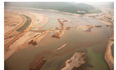
4大河川事業 (韓国・ナクトンガン)