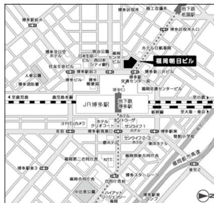
福岡朝日ビル TEL 092-431-1228 福岡市博多区博多駅前2-1-1