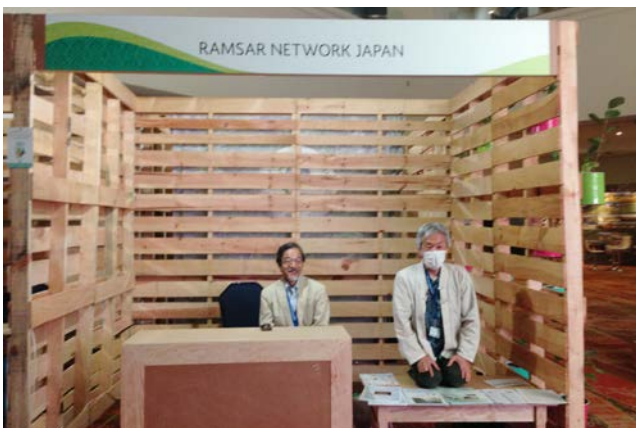
すっかり片付いた展示ブース

Fedexの閉まるギリギリ17時前に梱包が終了したので、慌てて係の人を呼んで取りに来てもらった。箱が崩壊しているのでFedexの箱に入れ替えて書類を作成するので、終わったら控えを届けると約束したのに来ない。カウンターに行ってみると丁度電気を消して帰るところであった。「あ、ごめん忘れた。明日でもいいか」と言われ、最後までメキシコのペースに翻弄される。