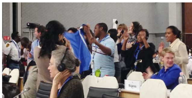
ダンスをする参加者

▼地元の子供たちのパフォーマンスの動画はこちら https://youtu.be/YaHYu7bp1Vo